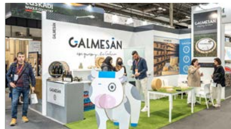
Nota: Imagen no vinculante.

Un espacio que se adapta a sus necesidades con un diseño elegante y funcional , perfecto para la exposición de su producto y la atención de los visitantes profesionales. La estructura y dotación son fijas variando en función del tamaño, desde 12 m 2 .