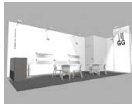
Stand 24 m 2