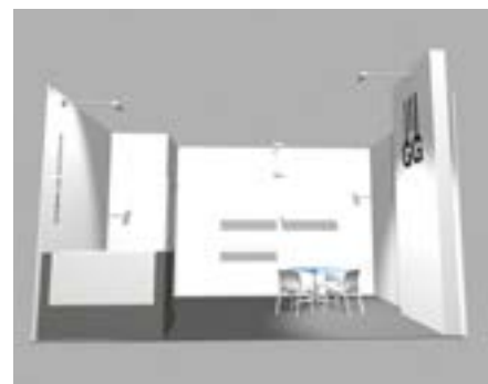
Stand 15 m 2