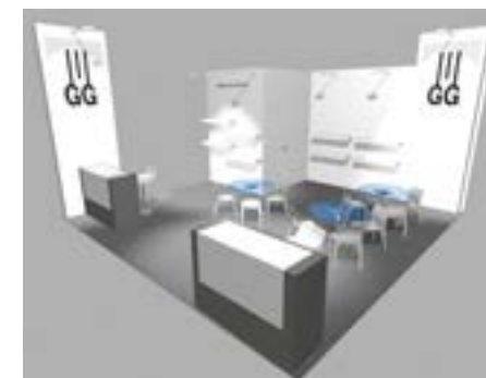
Stand 36 m 2