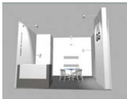
Stand 12 m 2