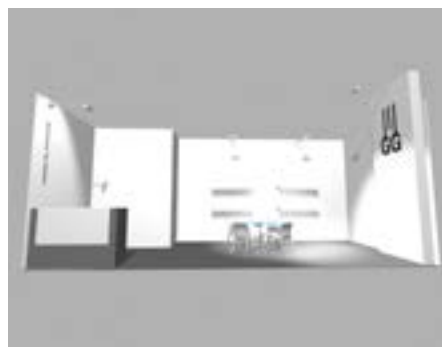
Stand 21 m 2