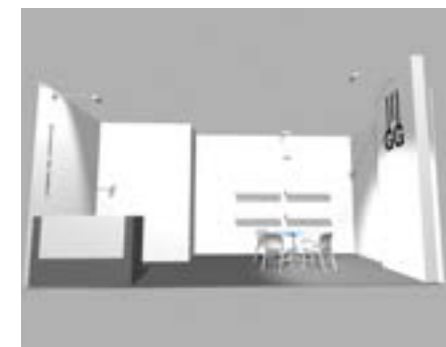
Stand 18 m 2