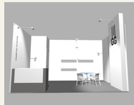
Stand 15 m 2