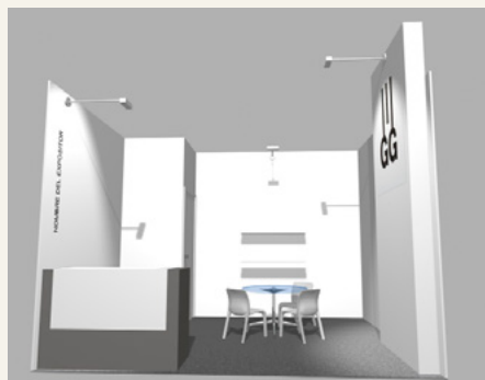
Stand 12 m 2