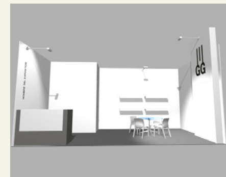
Stand 18 m 2