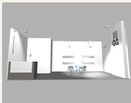
Stand 21 m 2