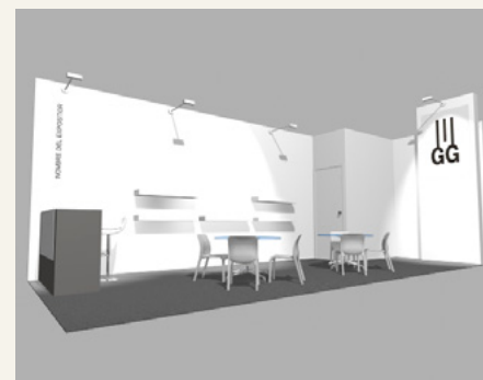
Stand 24 m 2